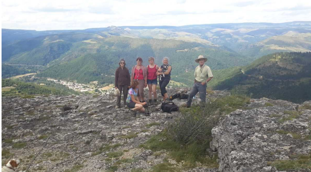
Pas toute l'équipe a reussi finir le sentier (le Rocher de Rochefort), mais quel cadeau !!!