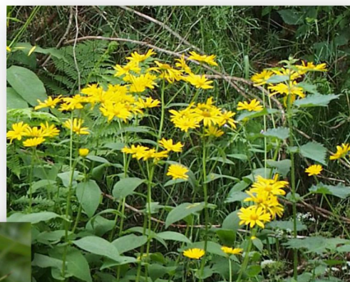
La doronic d'Autriche Doronicum austriacum

Mais quelques fois les merveilles comme la doronic d'Autriche ( Doronicum austriacum ), d'un jaune éclatant, et la luzule blanc-de-neige ( Luzula nivea ) ont échappée de notre côté.