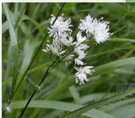
La luzule blanc-de-neige Luzula nivea

On a quitté la rivière et a commencé à monter le chemin forestière ; le bon moment déjà pour manger, dans une lisière typique, fraîche et ombragée. Les fruits de la forêt étaient tout autour ; quelques fraises des bois ( Fragaria vesca ) tout rouge, mais les myrtilles ( Vaccinium myrtillus ) et les framboises ( Rubus idaeus ), bien qu'abondantes, pas mûres.