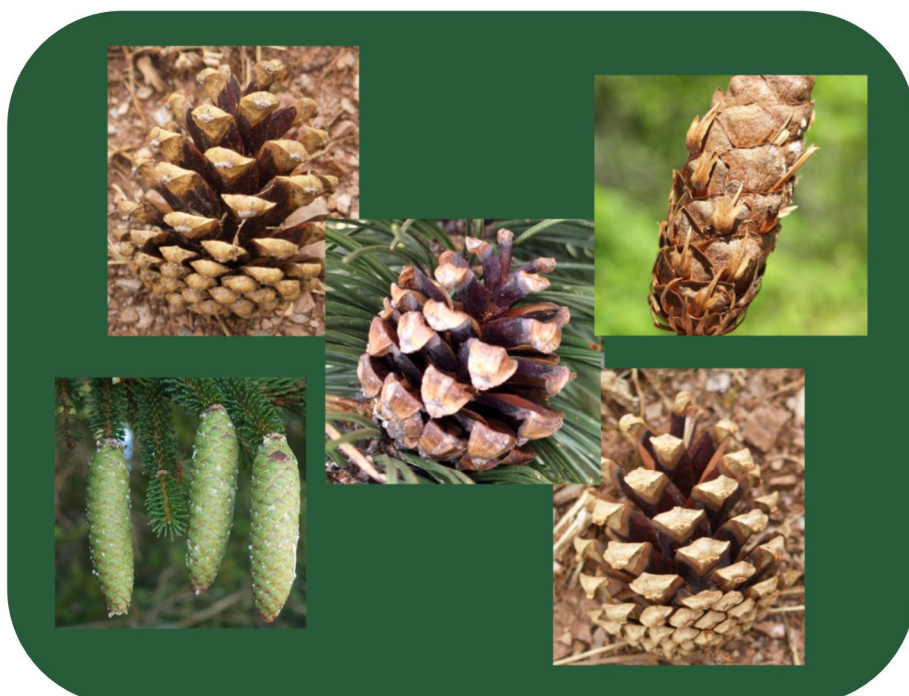
Les cônes n'étaient pas difficile à trouver.

Notre ancien forestier, Raymond, était mis à l'épreuve pour quelques autres : à priori, nous avons trouvé le pin à crochets ( Pinus mugo subsp. uncinata ), planté sur la crête de Mont Lozère, mais Raymond nous a averti qu'il ressemblait plutôt Pinus mugo subsp. mugo , moins étalés et inclinés. Apparemment, les graines se ressemblent et les arbres peuvent pousser ensemble ; souvent on n'a pas planté les bonnes graines par erreur.