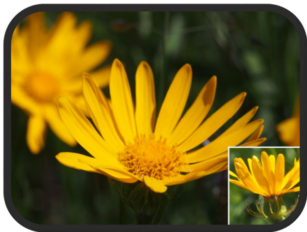
La doronic d'Autriche